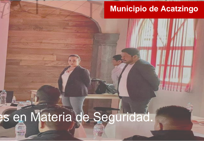
Gestión para capacitaciones en Materia de Seguridad.