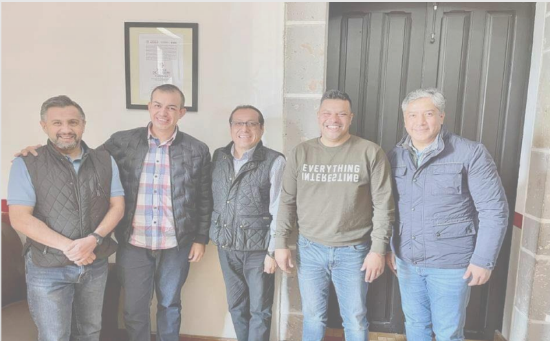
Tetela de Ocampo