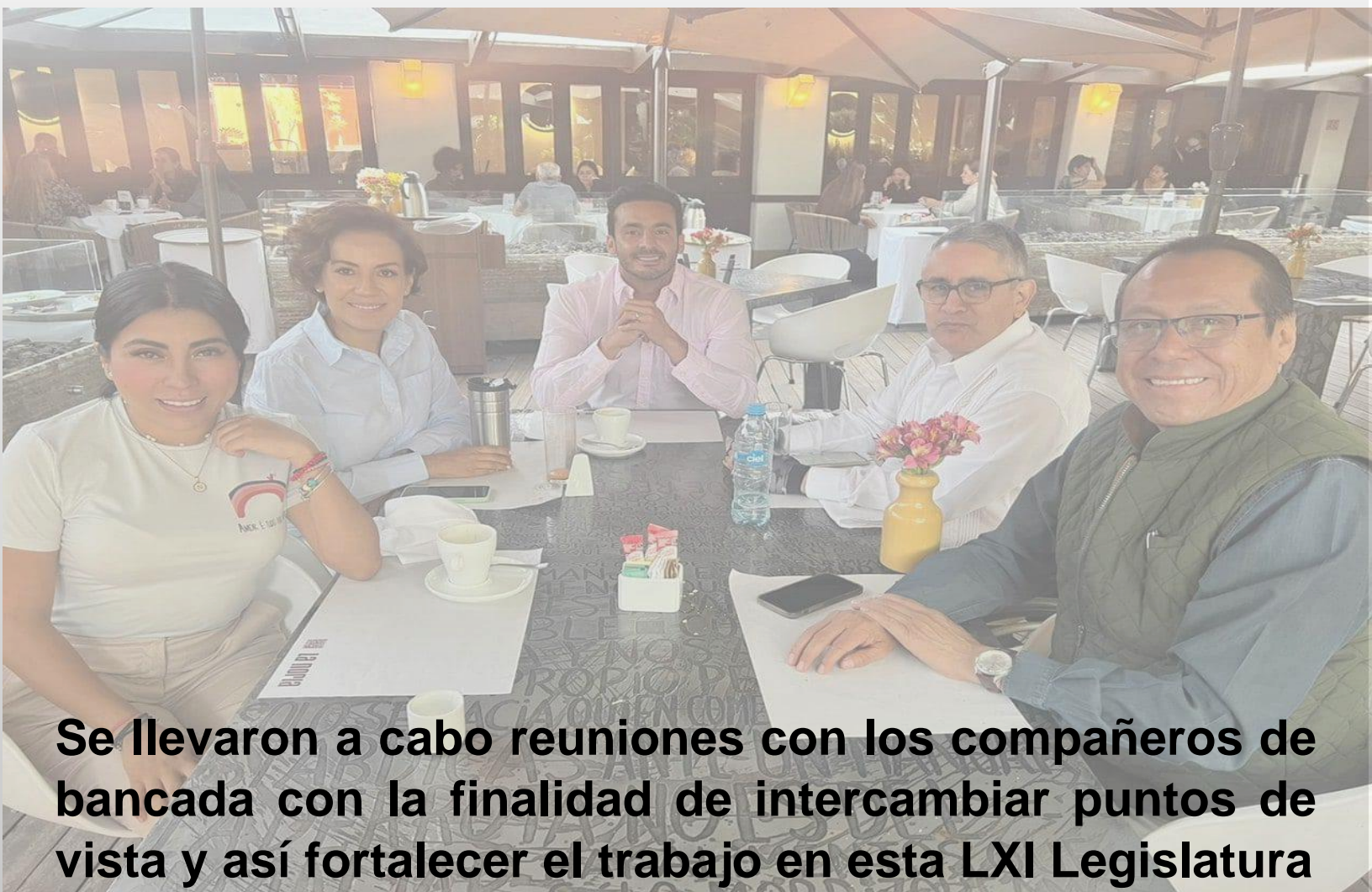
Se llevaron a cabo reuniones con los compañeros de bancada con la finalidad de intercambiar puntos de vista y así fortalecer el trabajo en esta LXI Legislatura