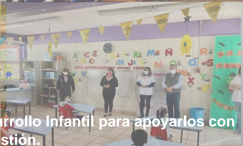
Visitamos los Centros de Desarrollo Infantil para apoyarlos con Gestión.