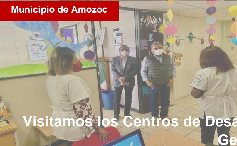
Municipio de Amozoc