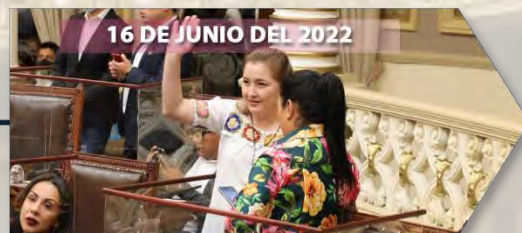
16 DE JUNIO DEL 2022