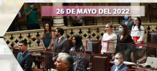
26 DE MAYO DEL 2022

Se reformó la Ley de Turismo del Estado de Puebla, Ley para la Regularización de Predios Rústicos, Urbanos y Suburbanos en el Régimen de Propiedad Privada del Estado de Puebla.