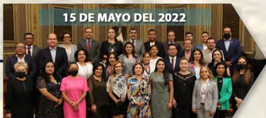
15 DE MAYO DEL 2022

Se designó a la Titular de la Auditoría Superior del Estado, se aprobaron diversos dictámenes y presentó la iniciativa de reforma a la Ley de Educación del Estado de Puebla.