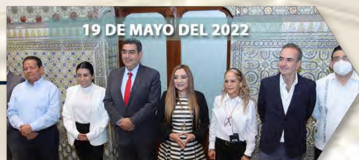
19 DE MAYO DEL 2022

Se designó a la Titular de la Auditoría Superior del Estado, se aprobaron diversos dictámenes y presentó la iniciativa de reforma a la Ley de Educación del Estado de Puebla.