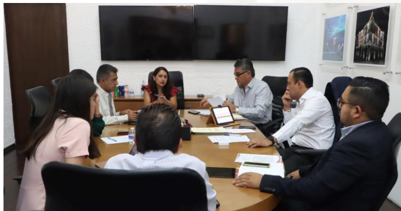
08 de mayo de 2023 Reunión con áreas directivas del H. Congreso del Estado de Puebla.

En este periodo, hemos realizado un total de cuatro reuniones con las áreas directivas del Congreso del Estado, para establecer los objetivos mensuales y resolver las situaciones que requieran nuestra intervención.