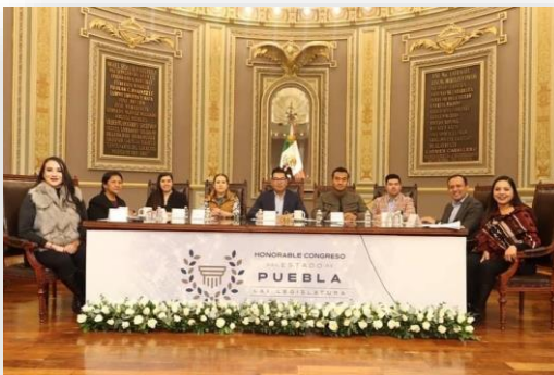
16 de diciembre de 2022 Instalación de Comisión Permanente del Primer periodo de Receso.