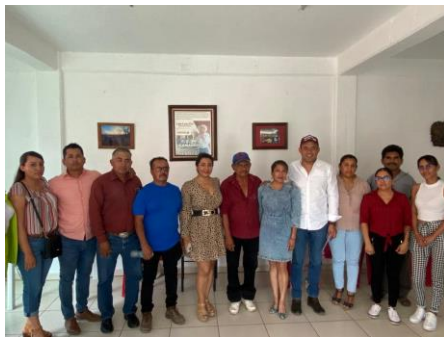
22 de abril de 2023 Atención de gestiones en casa de gestión

Estoy orgullosos de ser mixteco, y sin importar el calor inclemente, nunca dejaré sola mi gran familia mixteca.