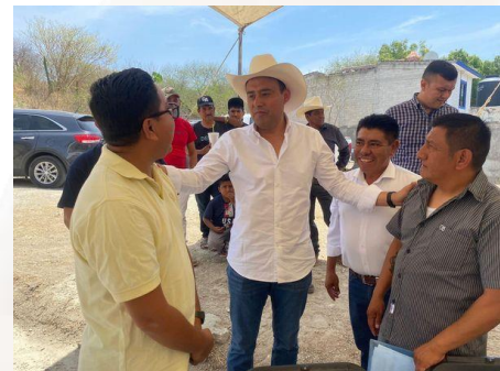
22 de abril de 2023 Recorrido en municipio de Tehuizingo