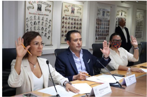
02 de mayo de 2022 Sesión de Procuración y Administración de Justicia.

Desde septiembre de 2021, tome el cargo de presidente de la Comisión de Procuración y Administración de la Justicia, una de las comisiones con mayor carga de trabajo dentro del H. Congreso del Estado de Puebla.