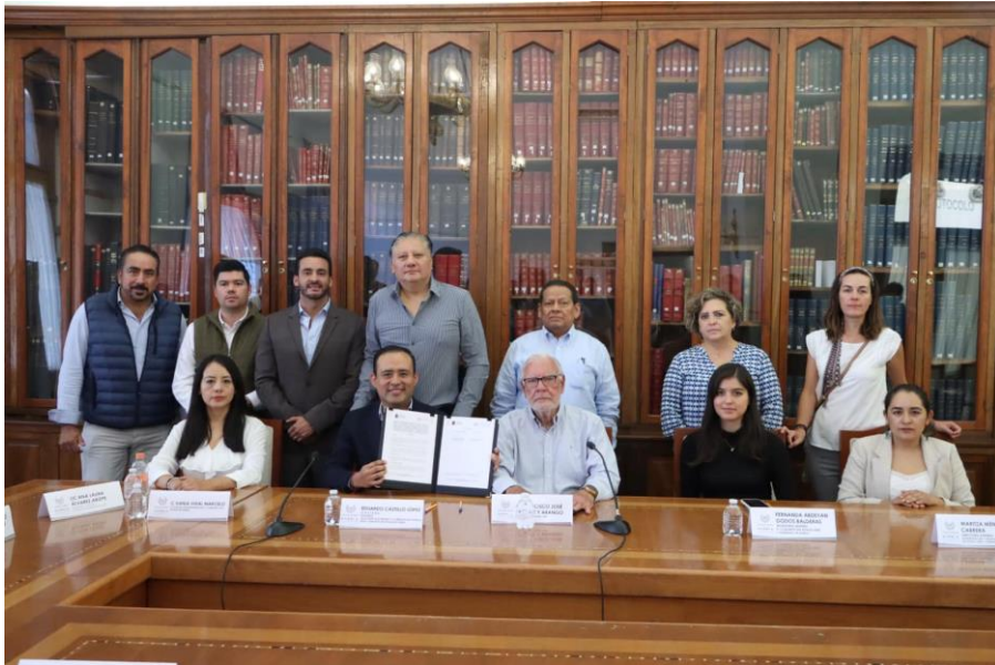
02 de mayo de 2023 Firma de convenio Fundación Nueva Esperanza.