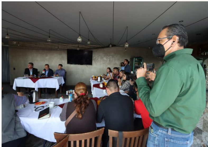
24 de abril de 2023 Rueda de prensa

Por tal motivo, en este periodo he organizado tres ruedas en prensa en las instalaciones del Congreso, con el objetivo de que las y los poblanos conozcan el actuar de sus representantes.