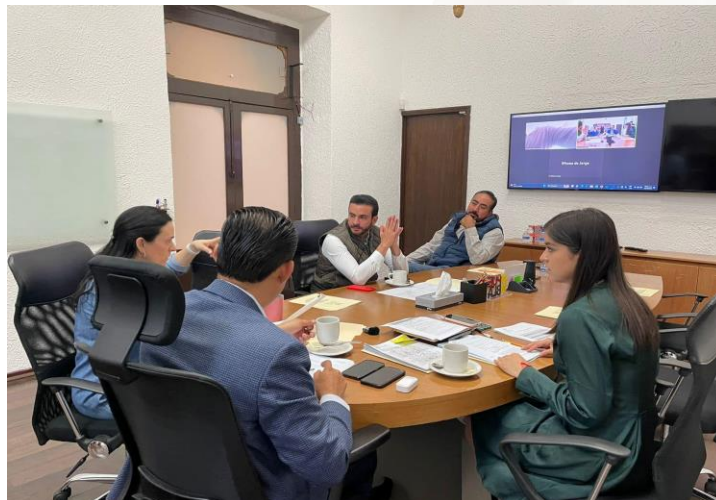
12 de mayo de 2023 Reunión de los integrantes de la JUGOCOPO.

De acuerdo con el artículo 96 de la Ley Orgánica del Poder Legislativo, la JUGOCOPO debe integrarse por los coordinadores de los grupos legislativos y por los Diputados de las Representaciones Legislativas, quienes tendrán derecho a voz y voto.