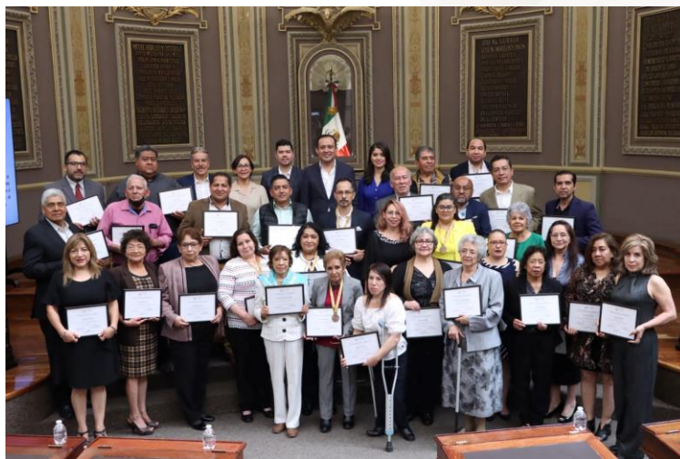
31 de marzo de 2023 Entrega de reconocimientos a los trabajadores del H. Congreso del Estado.

De igual forma, hemos realizado ceremonias para reconocer el mérito y esfuerzo de los trabajadores del Poder Legislativo, como es el caso de aquellos que tienen más de veinte años laborando y brindando su servicio al Estado.