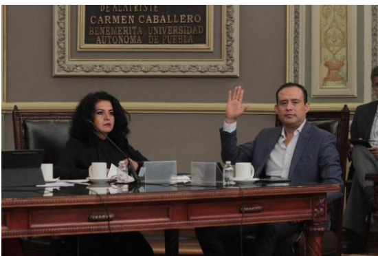
03 de mayo de 2023 Sesión de la Comisión Permanente.