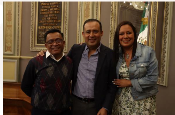
13 de abril de 2023 Sesión de la Comisión Permanente.