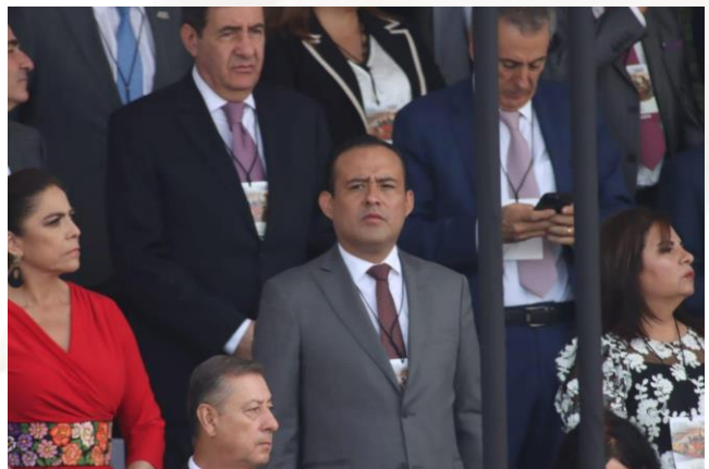
05 de mayo de 2023 Asistencia a Desfile cívico Militar por la batalla del 5 de mayo