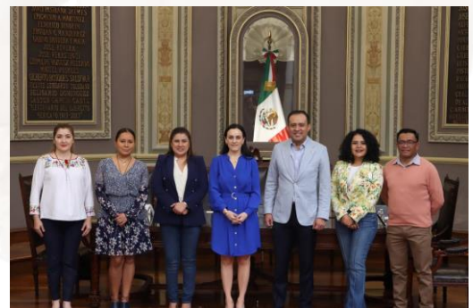
16 de marzo de 2023 Instalación de Comisión Permanente del Segundo periodo de Receso.