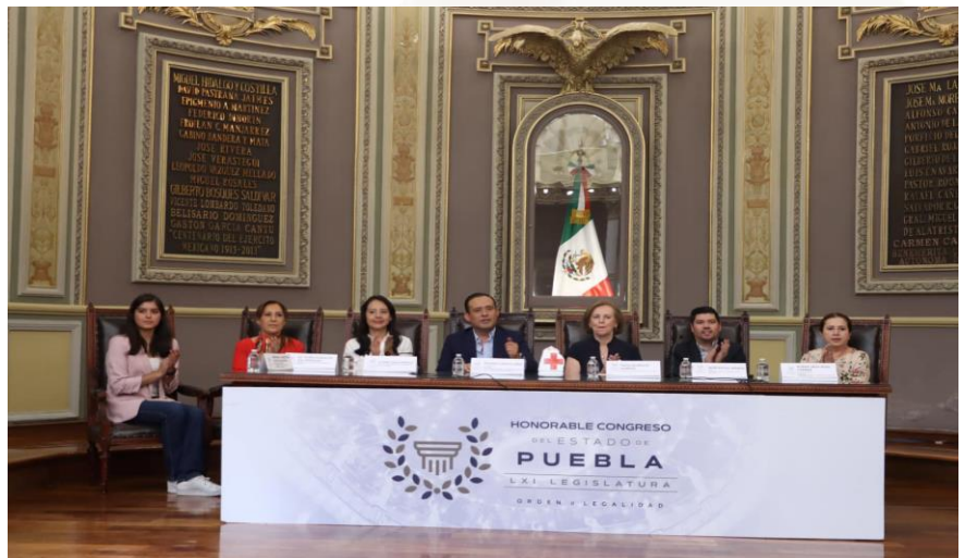
28 de abril de 2023 Entrega de cheque en favor de la Cruz Roja Ciudad de Puebla.