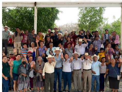
01 de abril de 2023 Recorrido en San Mateo Mimiapn