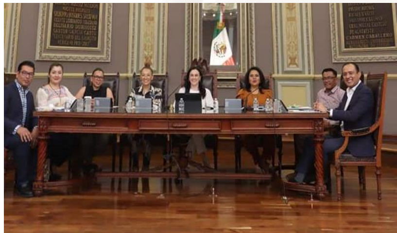
27 de abril de 2023 Sesión de la comisión permanente.

Como integrante de la LXI Legislatura, fui propuesto para ser miembro de la Comisión permanente en este periodo de receso legislativo