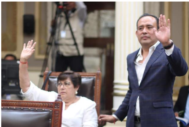
09 de mayo de 2023 Sesión extraordinaria

El día 09 de mayo de 2023 celebramos una reunión de carácter extraordinario para aprobar varios dictámenes, como es el caso de las precisiones a la reforma judicial para garantizar que las y los poblanos accedan a una justicia pronta y expedita.