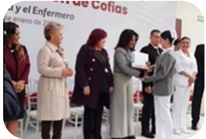
Salud y Educaci3n