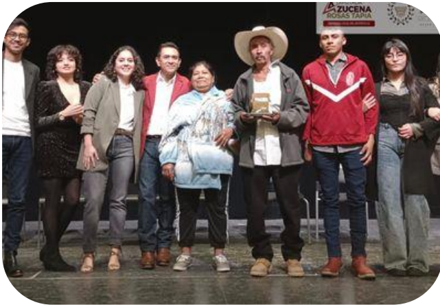
Promocion de las Tecnicas Agrarias