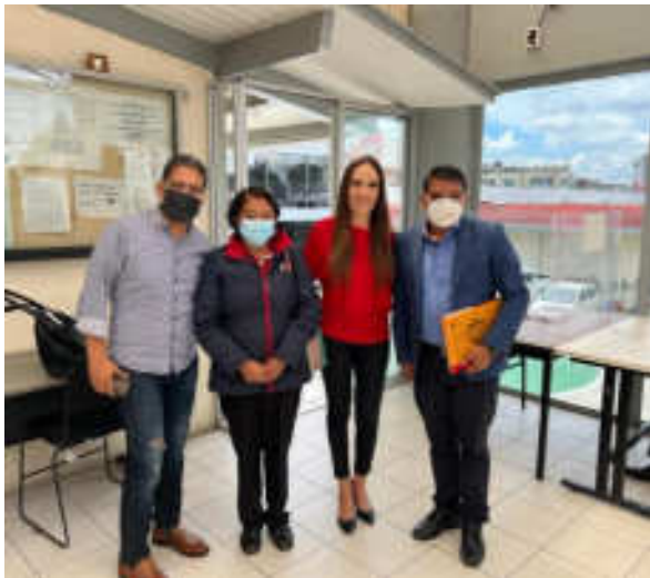
REUNIÓN Y VINCULACIÓN CON EL TITULAR DEL COMITÉ ADMINISTRADOR POBLANO PARA LA CONSTRUCCIÓN DE ESPACIOS EDUCATIVOS