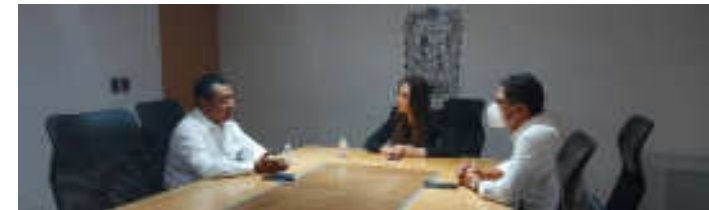
REUNIÓN CON EL REPRESENTANTE DE LA ÓPTICA EN CARGADA DE REALIZAR LAS JORNADAS VISUALES EN CASA DE GESTIÓN