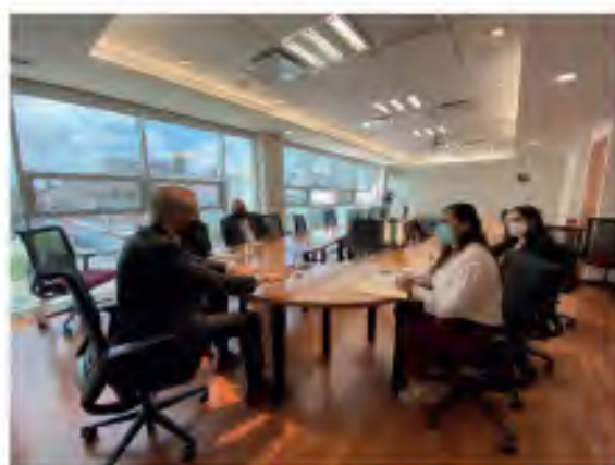
2.4 Mesa de trabajo con el SOAPAP para vinculación demandas ciudadanas.