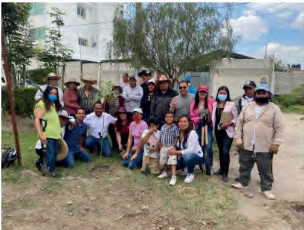
2.6 Faena en la Junta Auxiliar de San Aparicio.