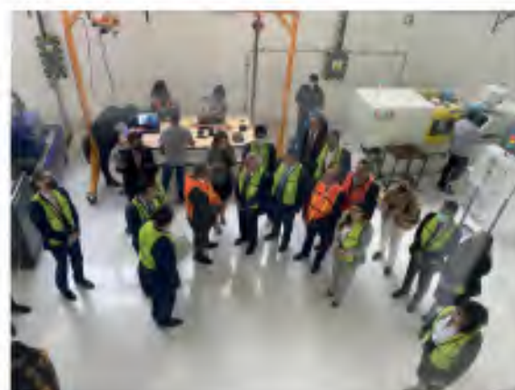
2.3 Visita Interinstitucional al Instituto Tecnológico de Puebla.