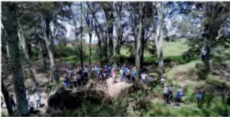
2.3 Reforestación 2022 SanMiguelEspejo #Ecorevolucionario