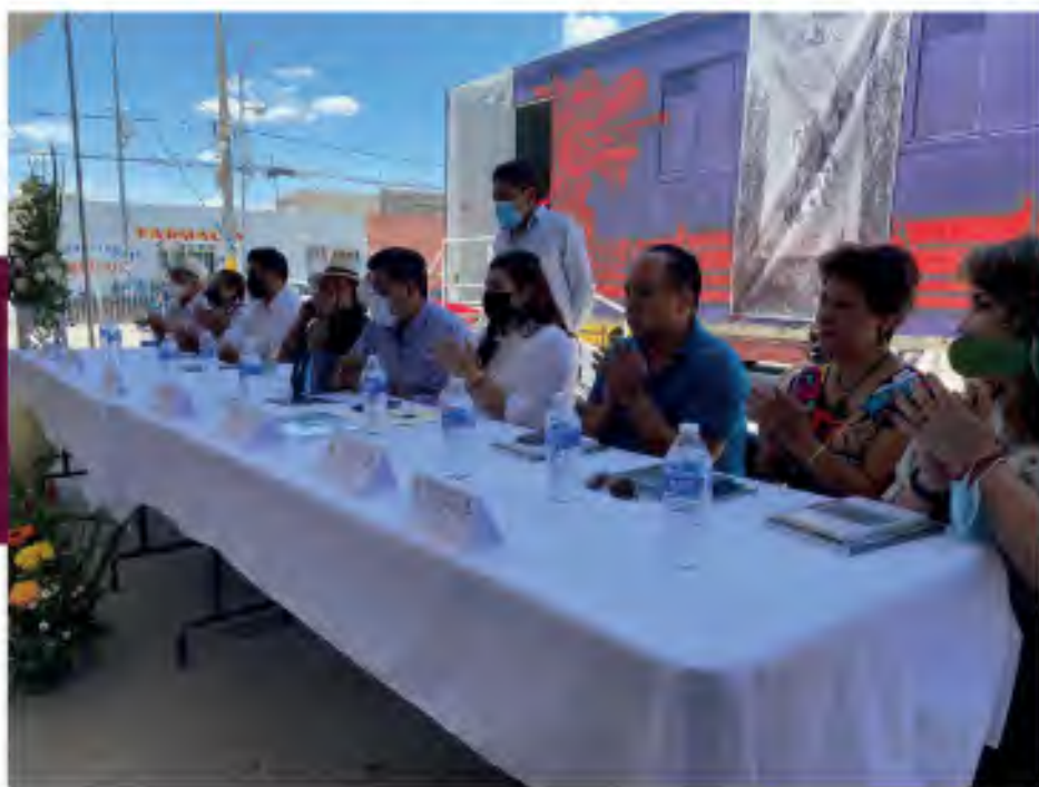
1.2 Apertura del Museo Itinerante de las Culturas Populares en la Junta Auxiliar de Xonacatepec

Es por tal motivo que estamos realizando actividades coordinadas, hombro con hombro, sociedad y trabajo legislativo para atender las necesidades de las colonias, unidades habitacionales, juntas auxiliares y dar respuesta a cada una de las peticiones. Acercarse a la ciudadanía en el tercer periodo de receso de informa y describe las actividades esenciales desarrolladas con la población, en las instalaciones de la casa de atención y vinculación ciudadana.