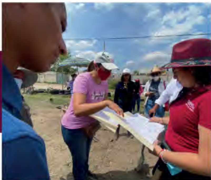
1.3 Se recogen y escuchan las necesidades de las personas que viven en el distrito. En la Junta Auxiliar de San Aparicio.

Desarrollo en los Derechos Humanos, la justicia social, la inclusión, la diversidad cultural, lingüística. El trabajo en territorio es una prioridad para conocer las problemáticas de mi distrito, ya que, a través de este trabajo, que se recogen las necesidades de los habitantes que viven en él.