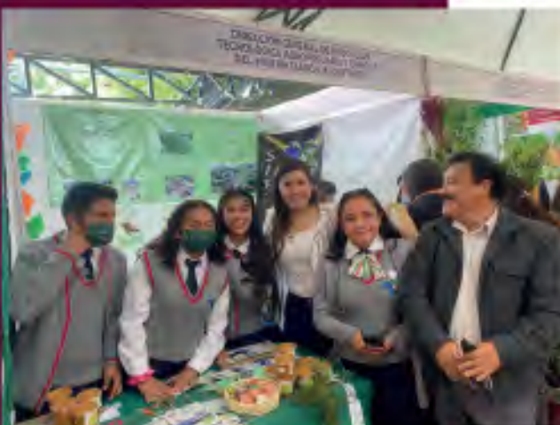
3.0 Feria del conocimiento, ciencia e innovación tecnológica de las instituciones educativas para el campo.