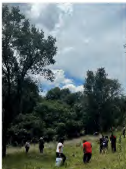
2.7 Reforestación en la Resurrección.

“De manera permanente la casa de atención ciudadana se mantiene como un recinto de encuentro para las comunidades del distrito principalmente a través de actividades que desarrollen las habilidades creativas de la población mientras se realiza un ejercicio de memoria histórica y rescate cultural. La importancia de resarcir el tejido social a través de la identidad de las comunidades es fundamental para empoderarlas y sembrar la semilla de la transformación”.