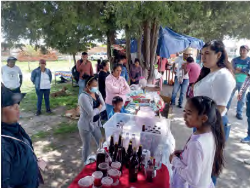
2.5 Impulso a la economía solidaria 2022 SanMiguelEspejo #Ecorevolucionario