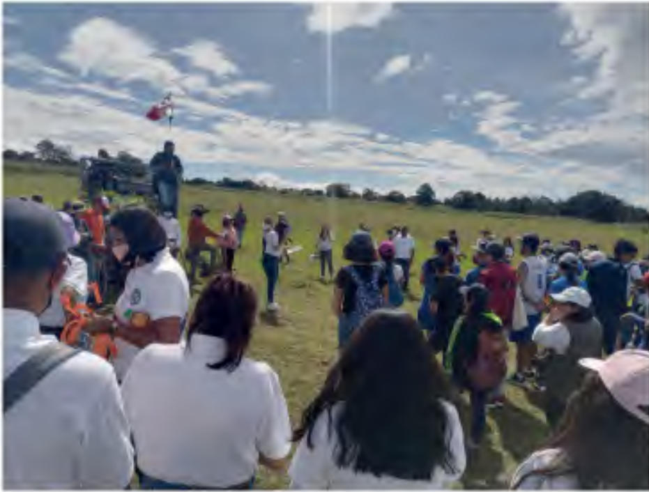
2.6 Reforestación 2022 SanMiguelEspejo #Ecorevolucionario