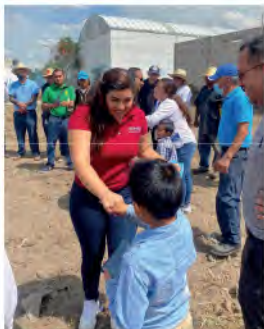
2.6 Faena en las colonias del distrito.