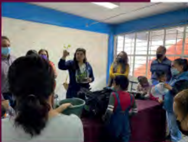
2.9 Curso “Conociendo el Huerto” en conjunto con la Escuela Juan. N. Méndez, donde aprendimos sobre la importancia de la autosuficiencia alimentaria, el cuidado y el control de plagas.

“De igual manera ejecutamos talleres de autosuficiencia alimentaria que buscan relacionar la filosofía de la Cultura de la Paz con ejercicios prácticos que además de educar brindan un beneficio permanente a las comunidades, tal es el caso del taller de huertos urbanos y siembra de traspatio ejecutado en varias escuelas de nuestro distrito donde los pequeños no solo aprenden a cuidar otros seres vivos sino la importancia del trabajo y de la cooperación en casa”