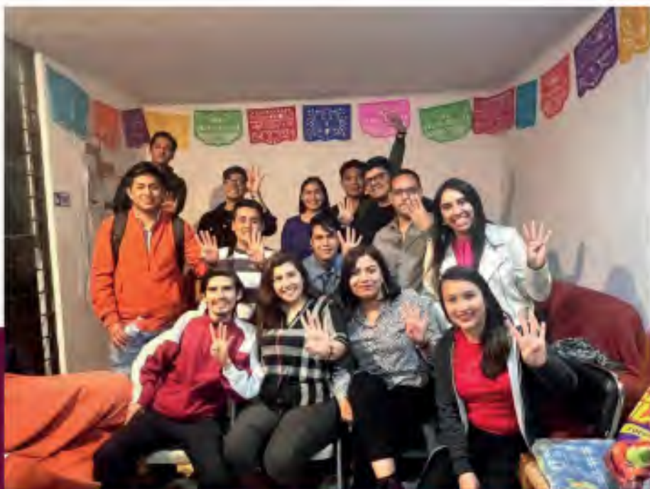
2.8 Formación Política en casa de atención ciudadana. Dtto 11 local.

“la formación política continua es la clave para dar una vida mejor y constituye el cimiento de todas las sociedades sólidas articuladas con la democracia participativa.”