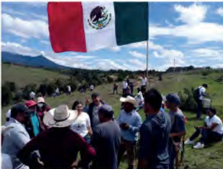
2.4 Faena y Reforestación 2022 SanMiguelEspejo #Ecorevolucionario