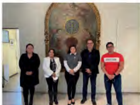
2.2 Mesa de trabajo interinstitucional con el INAH