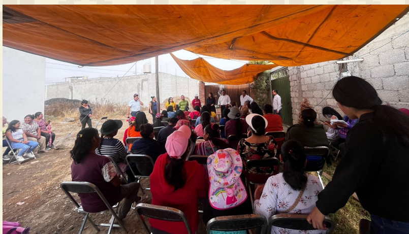
Foto tomada en casa de Atención Ciudadana.

Es muy importante estar en sus colonias, visitar, tocar puertas, organizar a la ciudadanía a la participación consciente de sus derechos y libertades políticas, nunca más estar lejanos de quien cree en los proyectos que surgen del pueblo y para el pueblo.