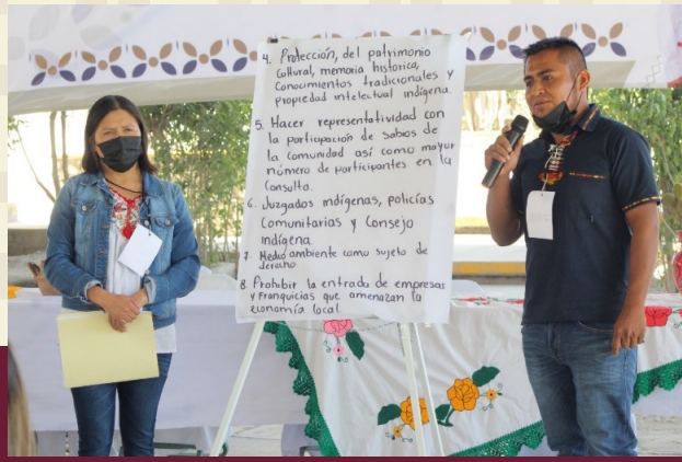
Proceso de Consulta. Foto tomada en San Pablito Pahuatlán. Mesas de trabajo.