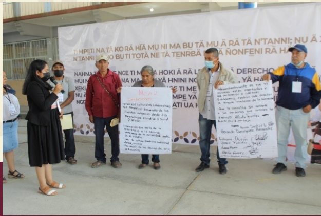
Proceso de Consulta. Foto tomada en San Felipe Otlaltepec, mesas de trabajo.